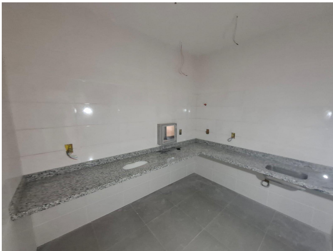
Imagem 06: Bancadas

Contrato: 014/2024 – Período Medido: 01/10/2025 a 31/10/2025