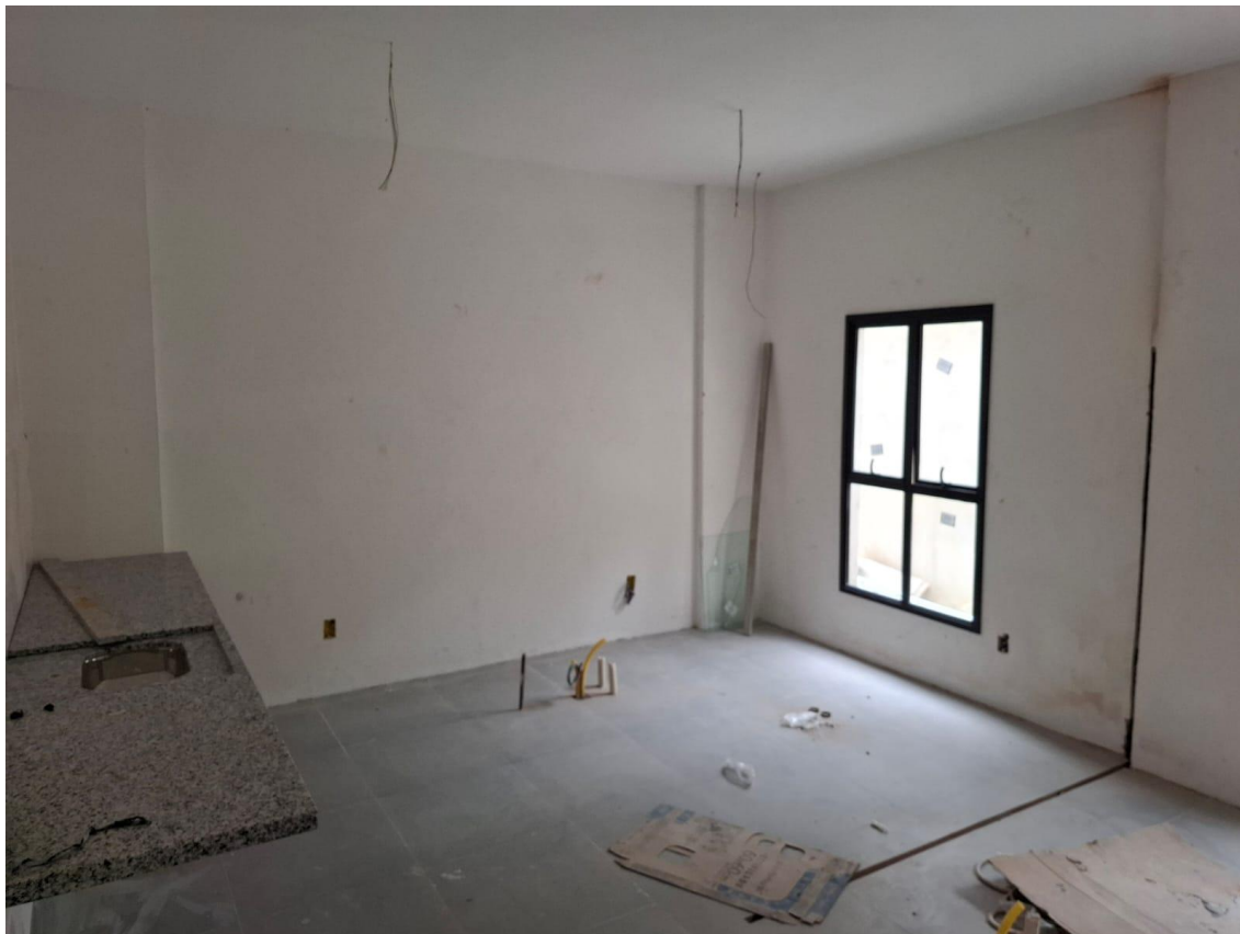
Imagem 03: Emassamento e pintura

Contrato: 014/2024 – Período Medido: 01/10/2025 a 31/10/2025