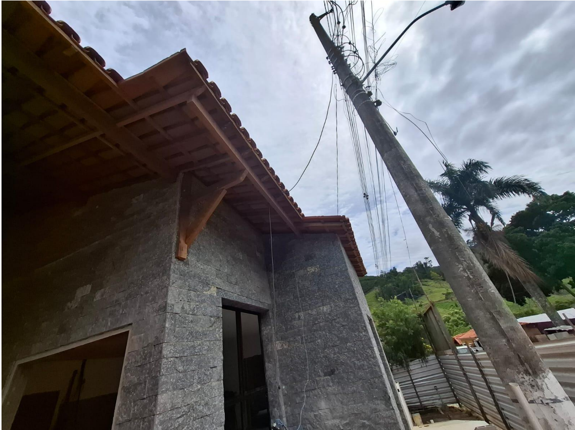
Imagem 09: Estrutura de madeira

Contrato: 014/2024 – Período Medido: 01/10/2025 a 31/10/2025