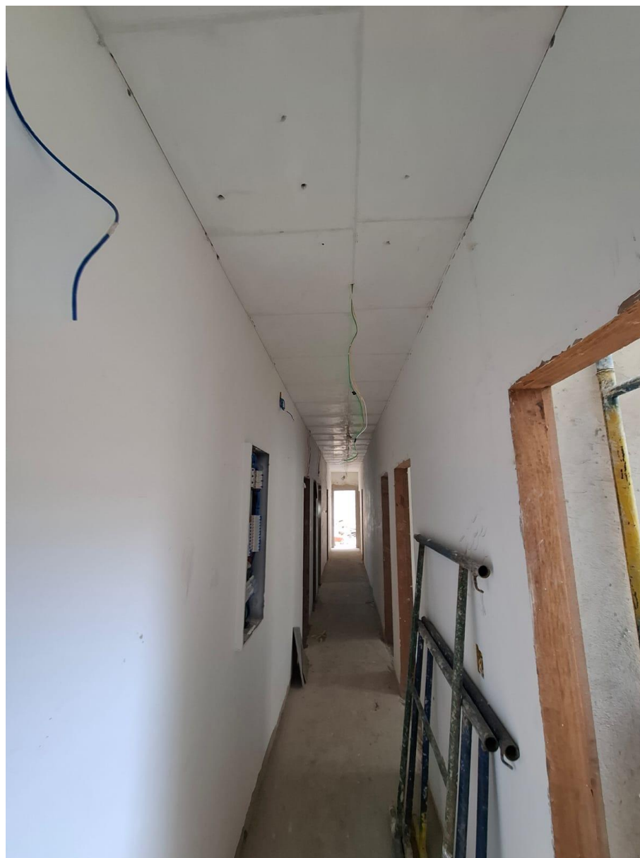
Imagem 02: Emassamento e pintura

Contrato: 014/2024 – Período Medido: 01/10/2025 a 31/10/2025