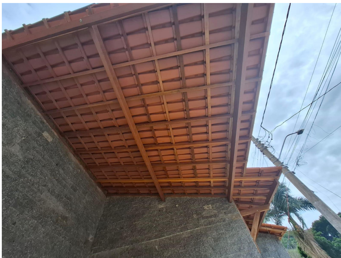
Imagem 01: estrutura de madeira

Contrato: 014/2024 – Período Medido: 01/10/2025 a 31/10/2025