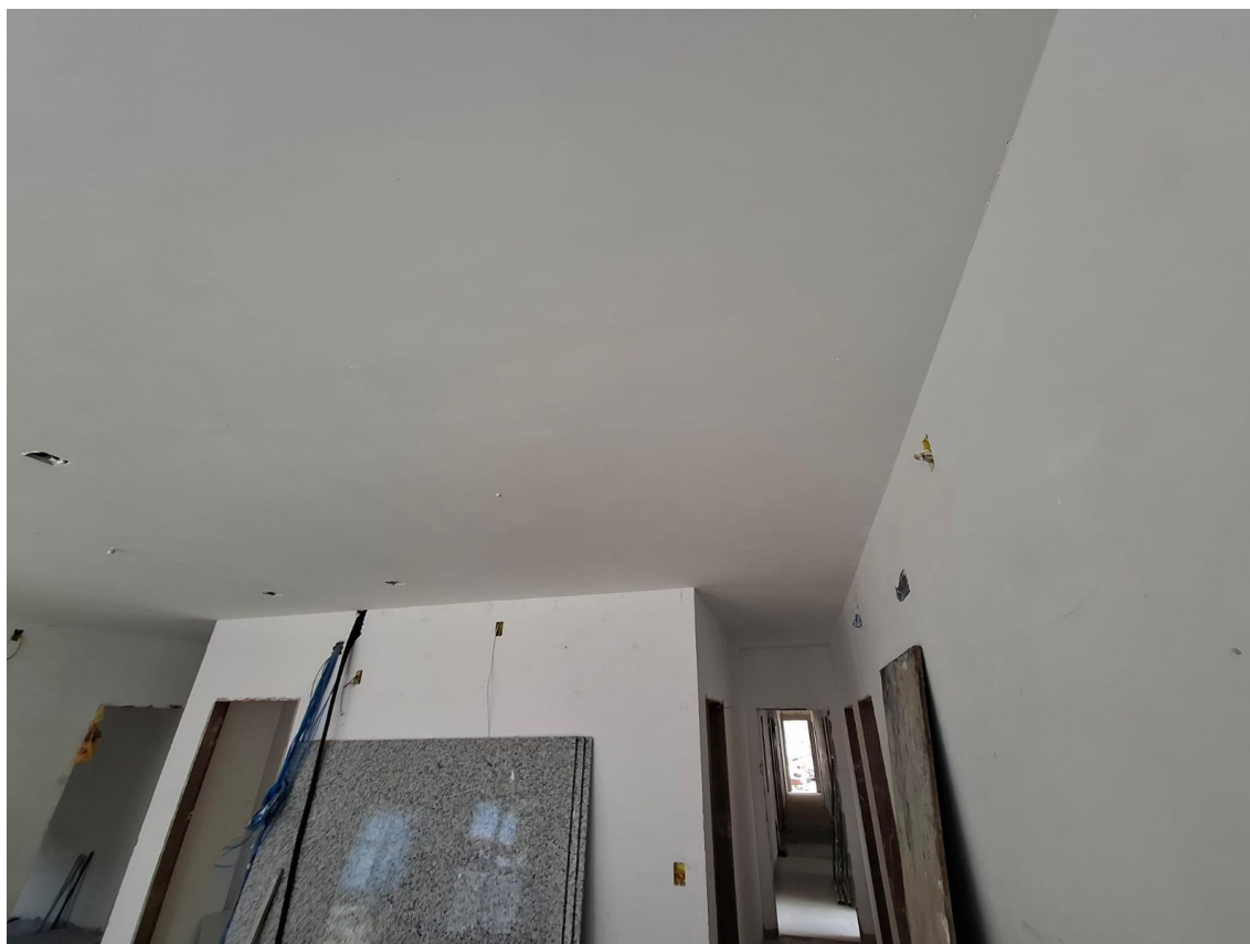
Imagem 08: forro de gesso

Contrato: 014/2024 – Período Medido: 01/10/2025 a 31/10/2025