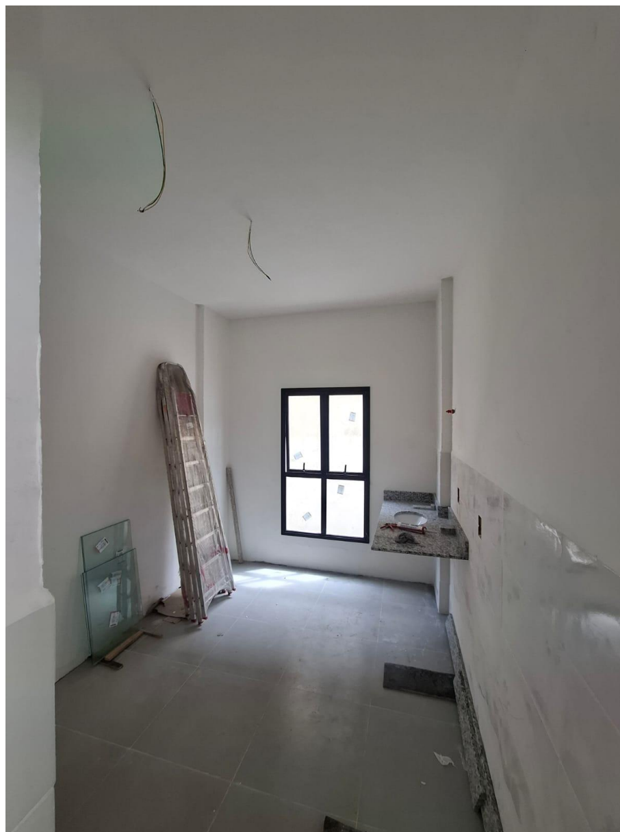
Imagem 04: Emassamento e pintura

Contrato: 014/2024 – Período Medido: 01/10/2025 a 31/10/2025