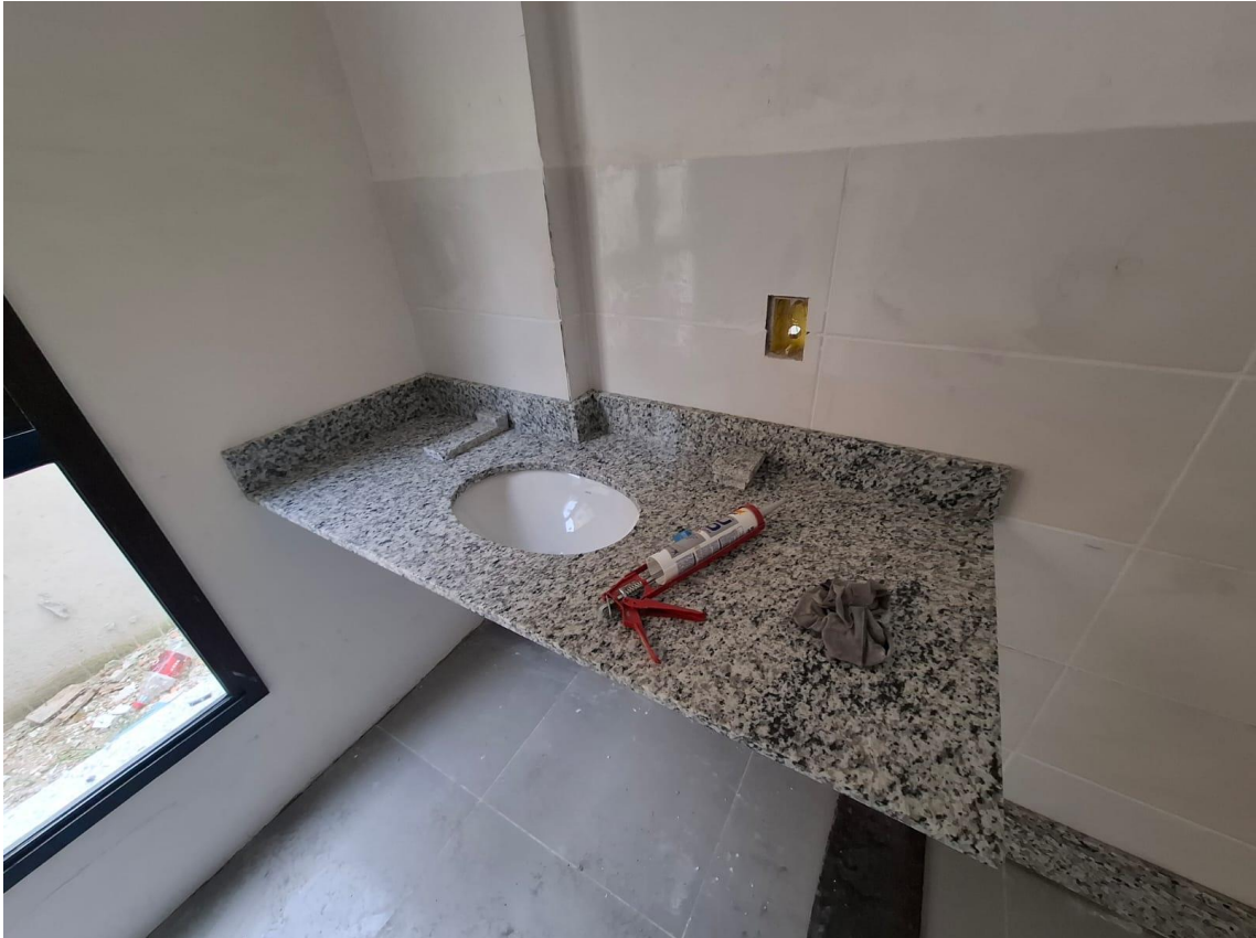
Imagem 10: Bancadas

Contrato: 014/2024 – Período Medido: 01/10/2025 a 31/10/2025