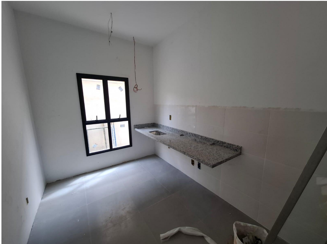
Imagem 07: Bancadas

Contrato: 014/2024 – Período Medido: 01/10/2025 a 31/10/2025