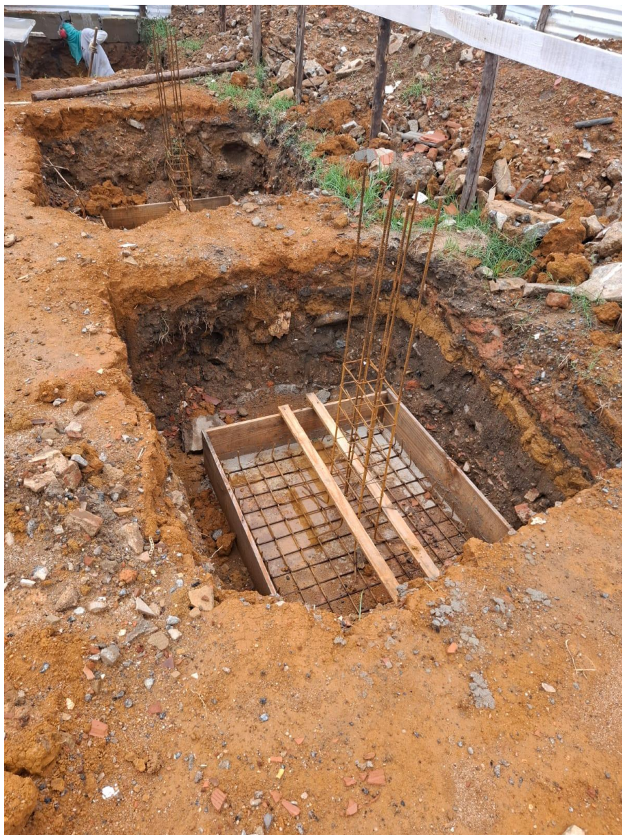
Imagem 04: escavação e armação

Contrato: 014/2025 – Período Medido: 14/11/2025 a 31/12/2025