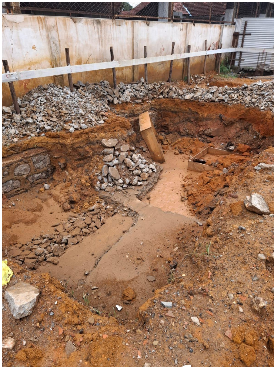
Imagem 01: escavação

Contrato: 014/2025 – Período Medido: 14/11/2025 a 31/12/2025