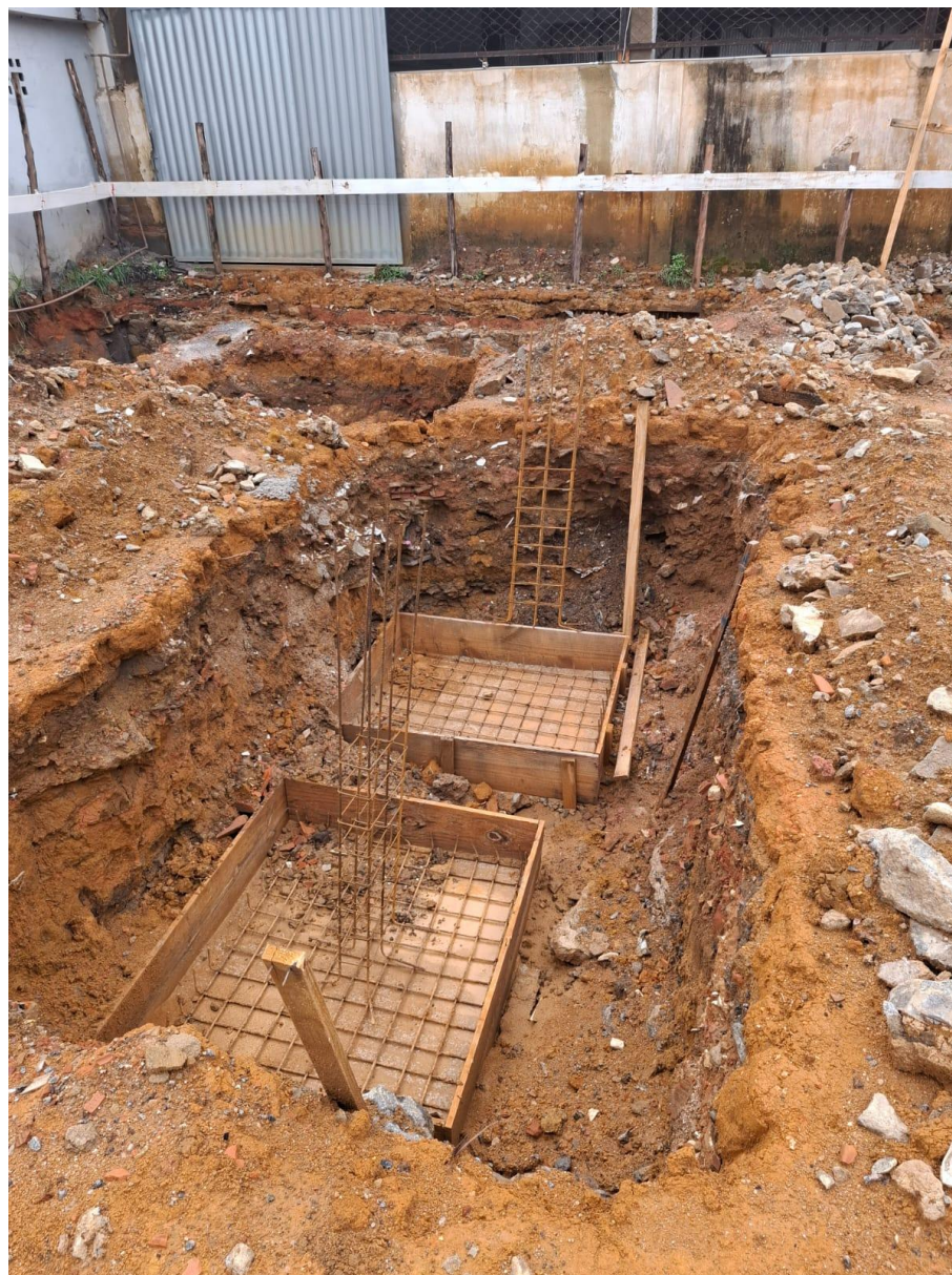
Imagem 02: escavação e armação

Contrato: 014/2025 – Período Medido: 14/11/2025 a 31/12/2025