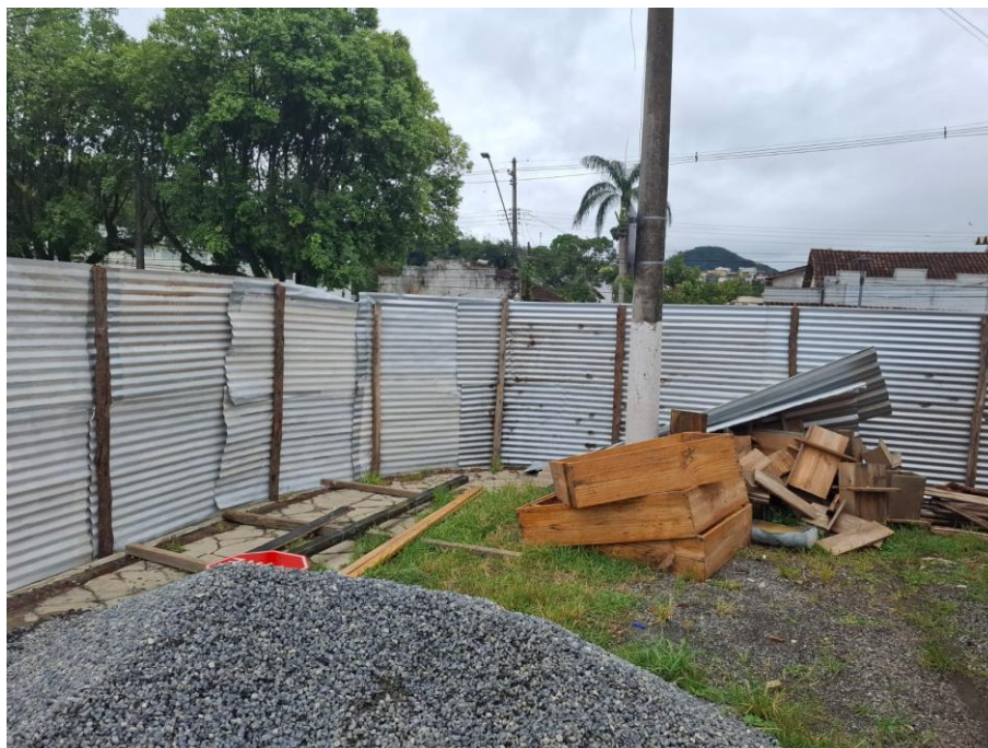
Imagem 13: barração vestiário

Contrato: 014/2025 – Período Medido: 14/11/2025 a 31/12/2025