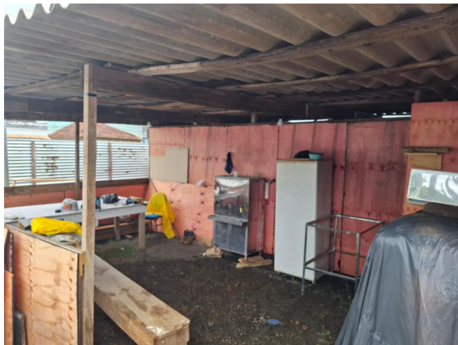
Imagem 09: barração refeitório

Contrato: 014/2025 – Período Medido: 14/11/2025 a 31/12/2025