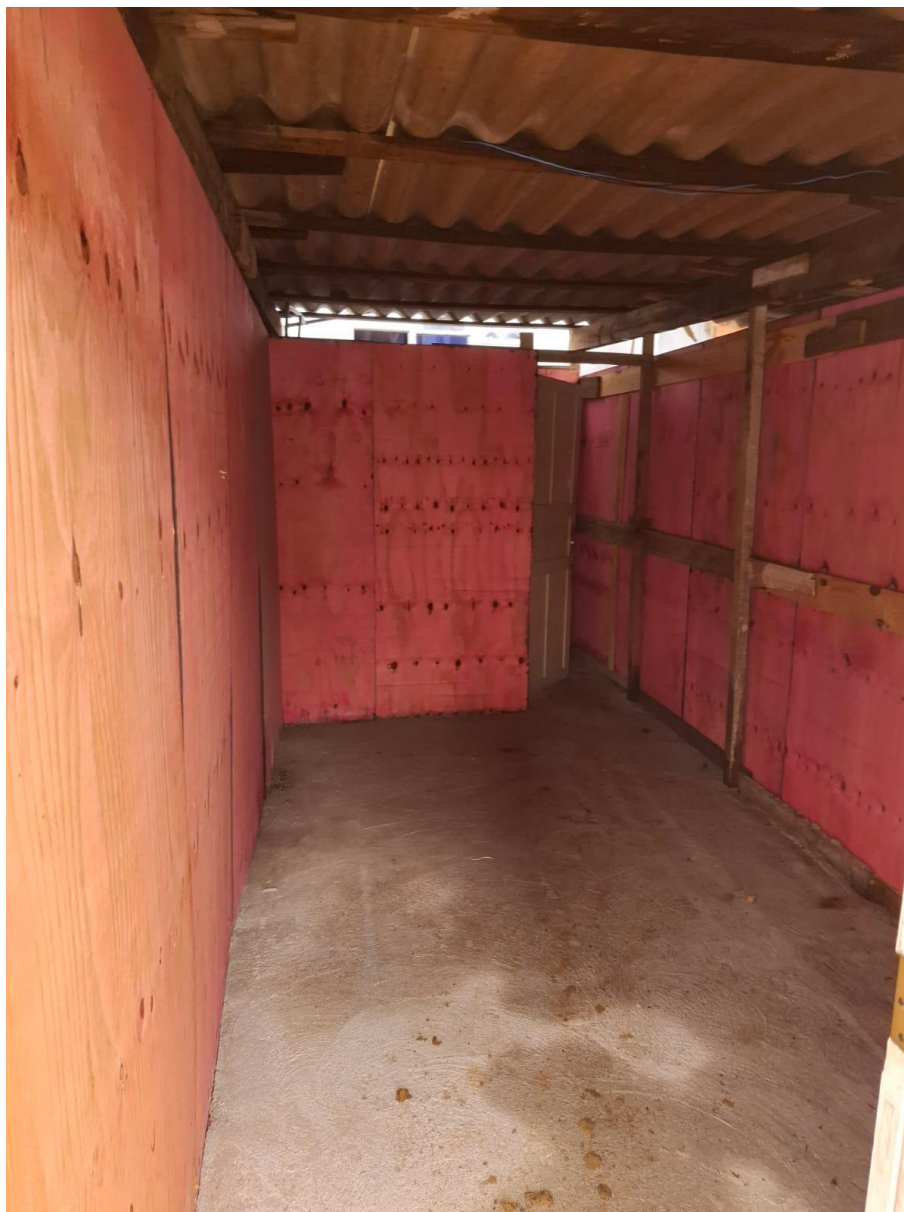
Imagem 07: barracão escritório

Contrato: 014/2025 – Período Medido: 14/11/2025 a 31/12/2025