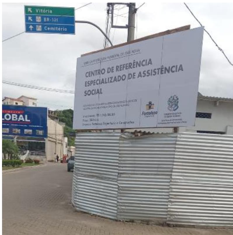
Imagem 14: Placa de obra

Contrato: 014/2025 – Período Medido: 14/11/2025 a 31/12/2025