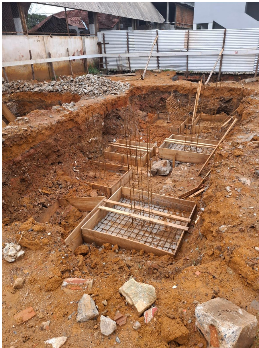
Imagem 06: escavação e armação

Contrato: 014/2025 – Período Medido: 14/11/2025 a 31/12/2025