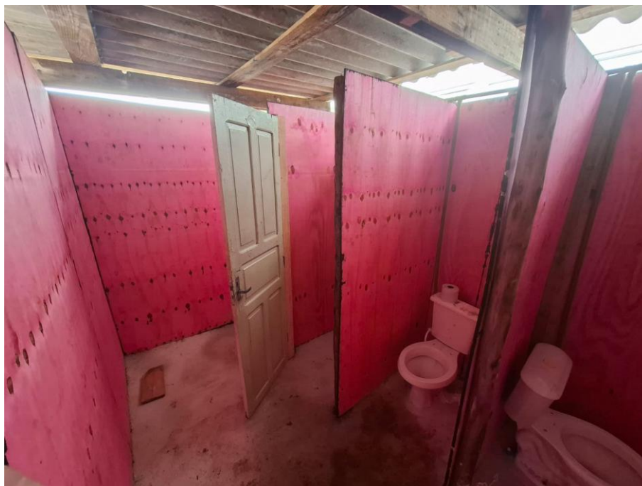
Imagem 12: barração vestiário