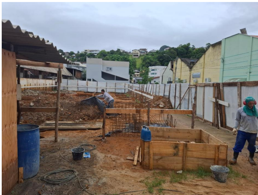
Imagem 11: forma fundação

Contrato: 014/2025 – Período Medido: 14/11/2025 a 31/12/2025