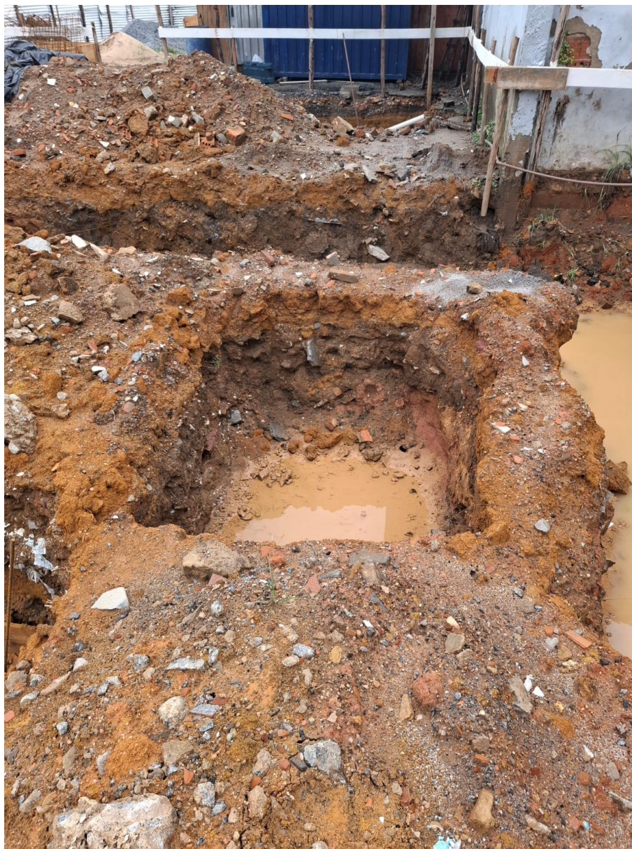
Imagem 03: escavação

Contrato: 014/2025 – Período Medido: 14/11/2025 a 31/12/2025