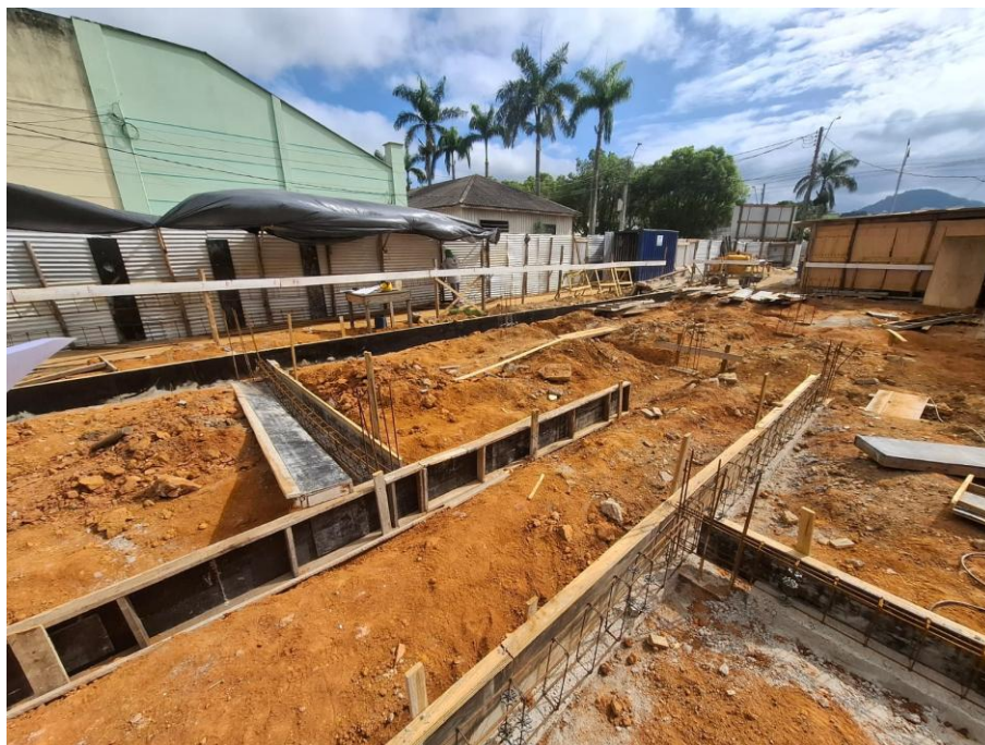
Imagem 07: Aterro, forma, armação, concreto magro e concreto estrutural

Contrato: 014/2025 – Período Medido: 01/01/2026 a 31/01/2026