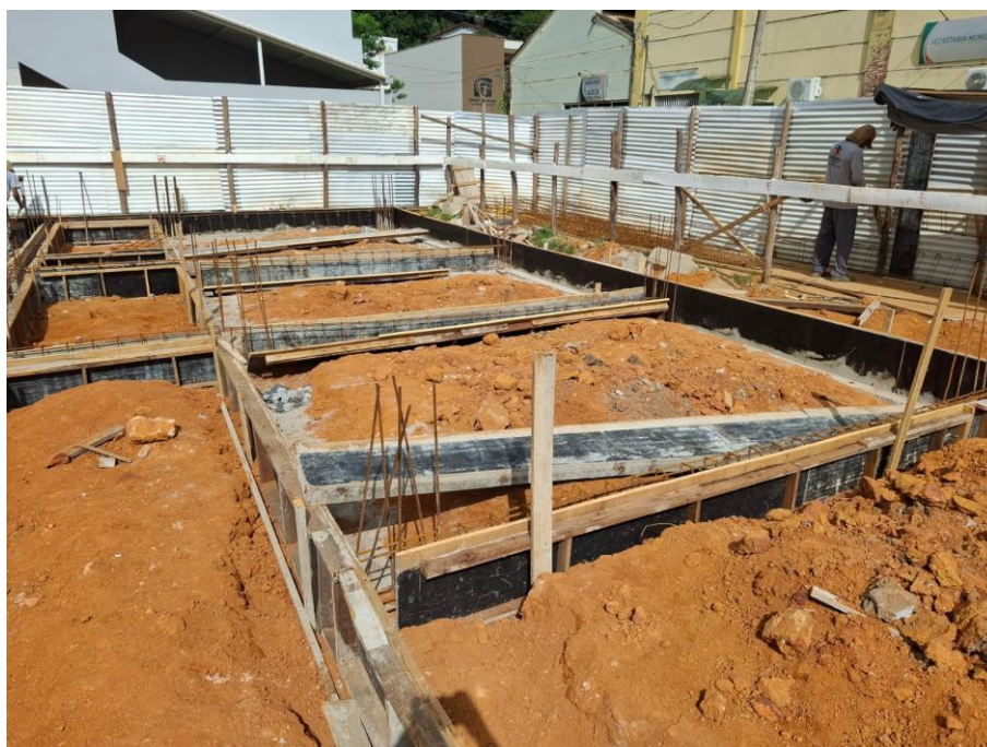
Imagem 06: Aterro, forma, armação, concreto magro e concreto estrutural