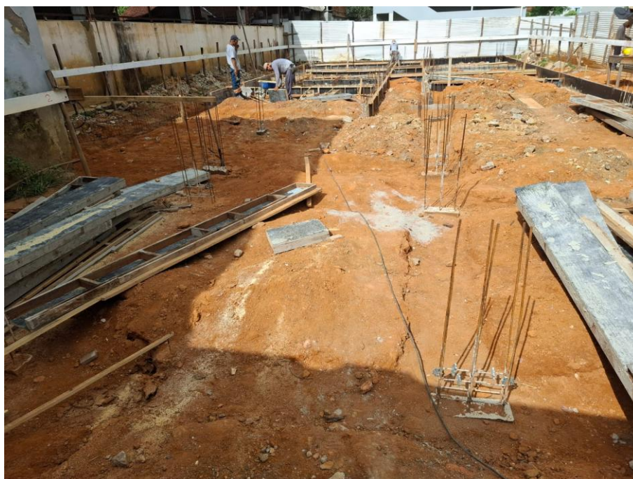
Imagem 04: Aterro, forma, armação, concreto magro e concreto estrutural