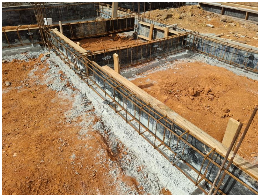
Imagem 05: Aterro, forma, armação, concreto magro e concreto estrutural

Contrato: 014/2025 – Período Medido: 01/01/2026 a 31/01/2026