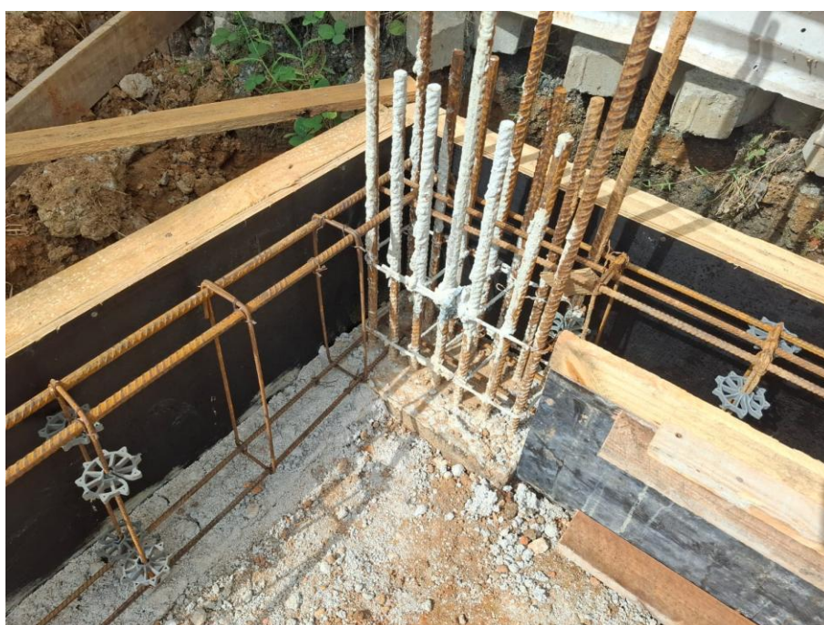
Imagem 02: Aterro, forma, armação, concreto magro e concreto estrutural