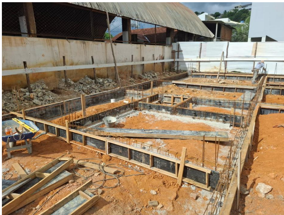
Imagem 03: Aterro, forma, armação, concreto magro e concreto estrutural

Contrato: 014/2025 – Período Medido: 01/01/2026 a 31/01/2026