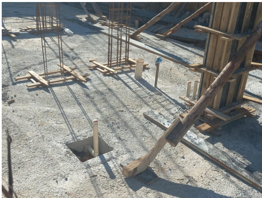
Imagem 07: forma, armação, tubulação e concreto estrutural

Contrato: 014/2025 – Período Medido: 01/02/2026 a 28/02/2026