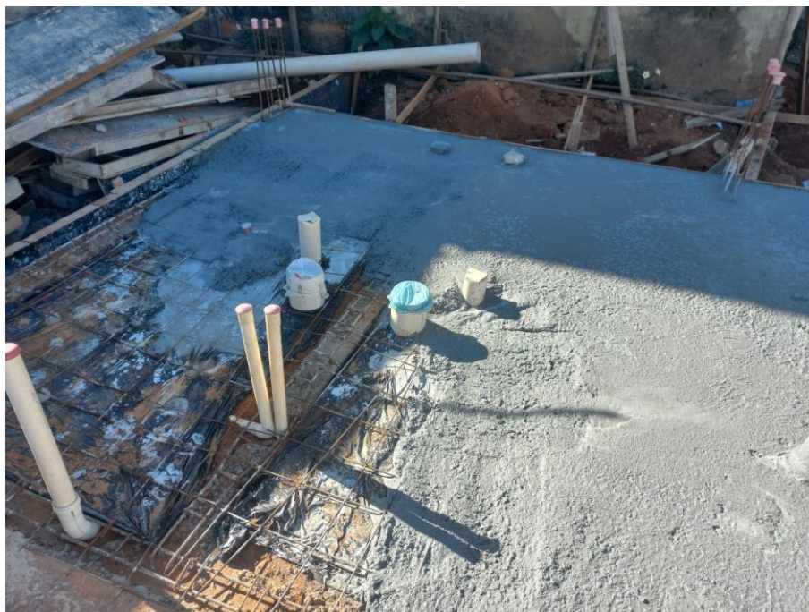
Imagem 05: forma, armação, tubulação e concreto estrutural

Contrato: 014/2025 – Período Medido: 01/02/2026 a 28/02/2026