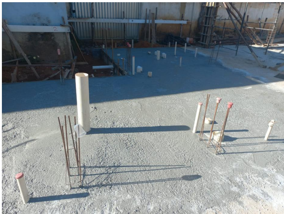
Imagem 03: forma, armação, tubulação e concreto estrutural

Contrato: 014/2025 – Período Medido: 01/02/2026 a 28/02/2026