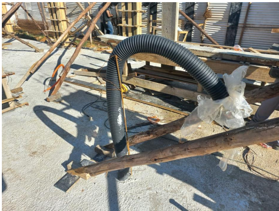
Imagem 01: forma, armação, tubulação e concreto estrutural

Contrato: 014/2025 – Período Medido: 01/02/2026 a 28/02/2026