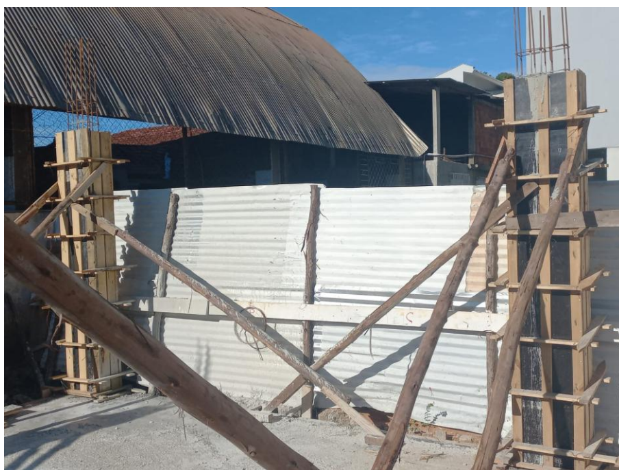
Imagem 04: forma, armação, tubulação e concreto estrutural