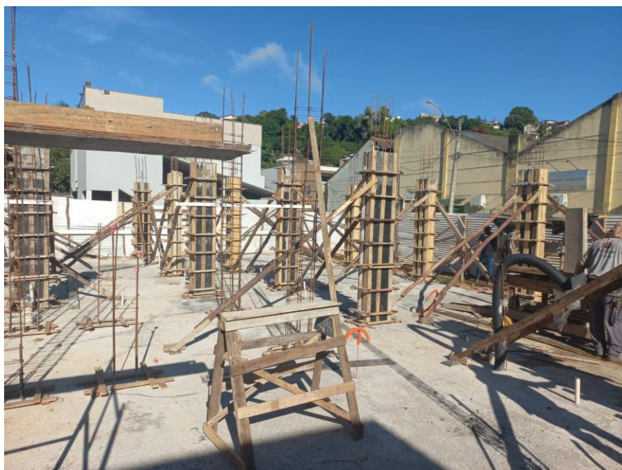
Imagem 06: forma, armação, tubulação e concreto estrutural