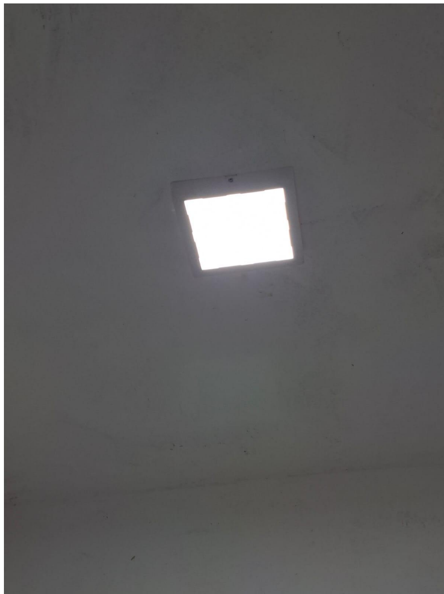
Imagem 05: Gesso com luminária

Contrato: 015/2024 – Período Medido: 01/12/2025 a 31/03/2026