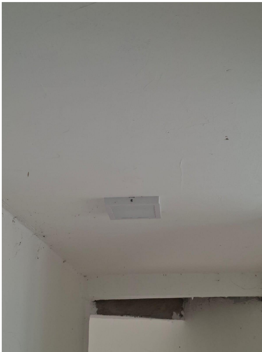
Imagem 02: Gesso com luminária

Contrato: 015/2024 – Período Medido: 01/12/2025 a 31/03/2026