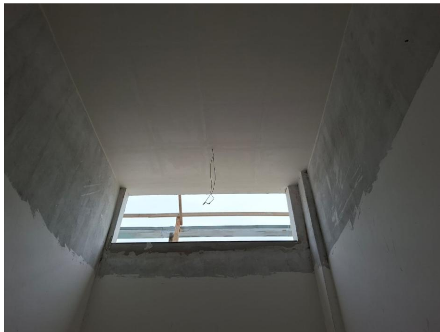
Imagem 03: forro de gesso instalado

Contrato: 015/2024 – Período Medido: 01/12/2025 a 31/03/2026