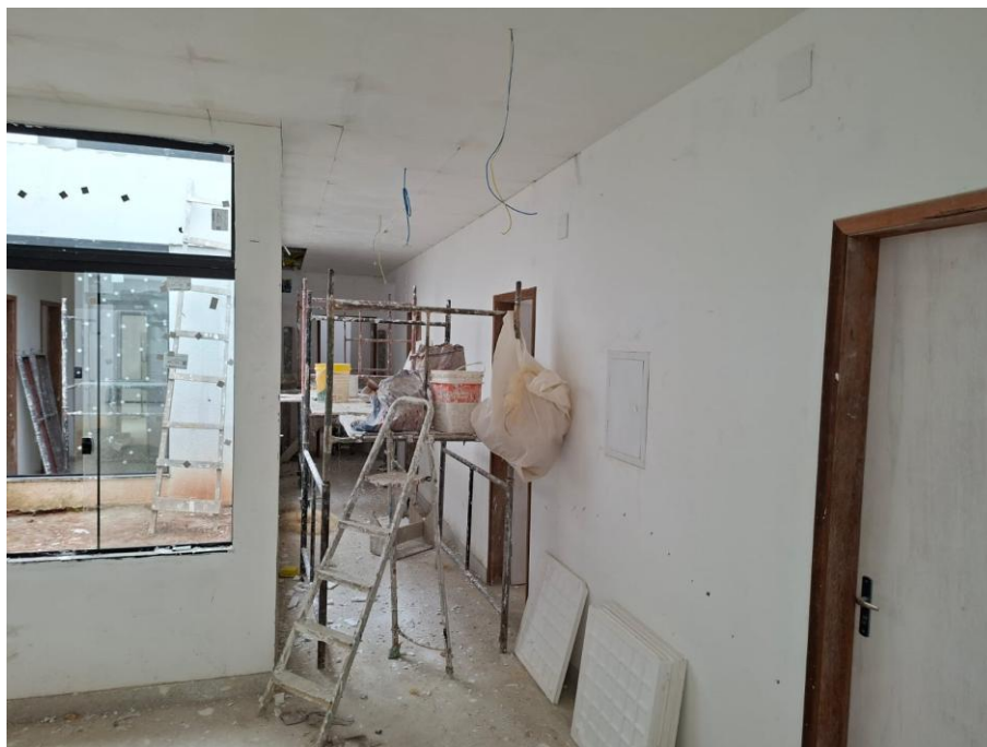
Imagem 07: Gesso, parte elétrica e rede lógica instalada no corredor

Contrato: 015/2024 – Período Medido: 01/12/2025 a 31/03/2026