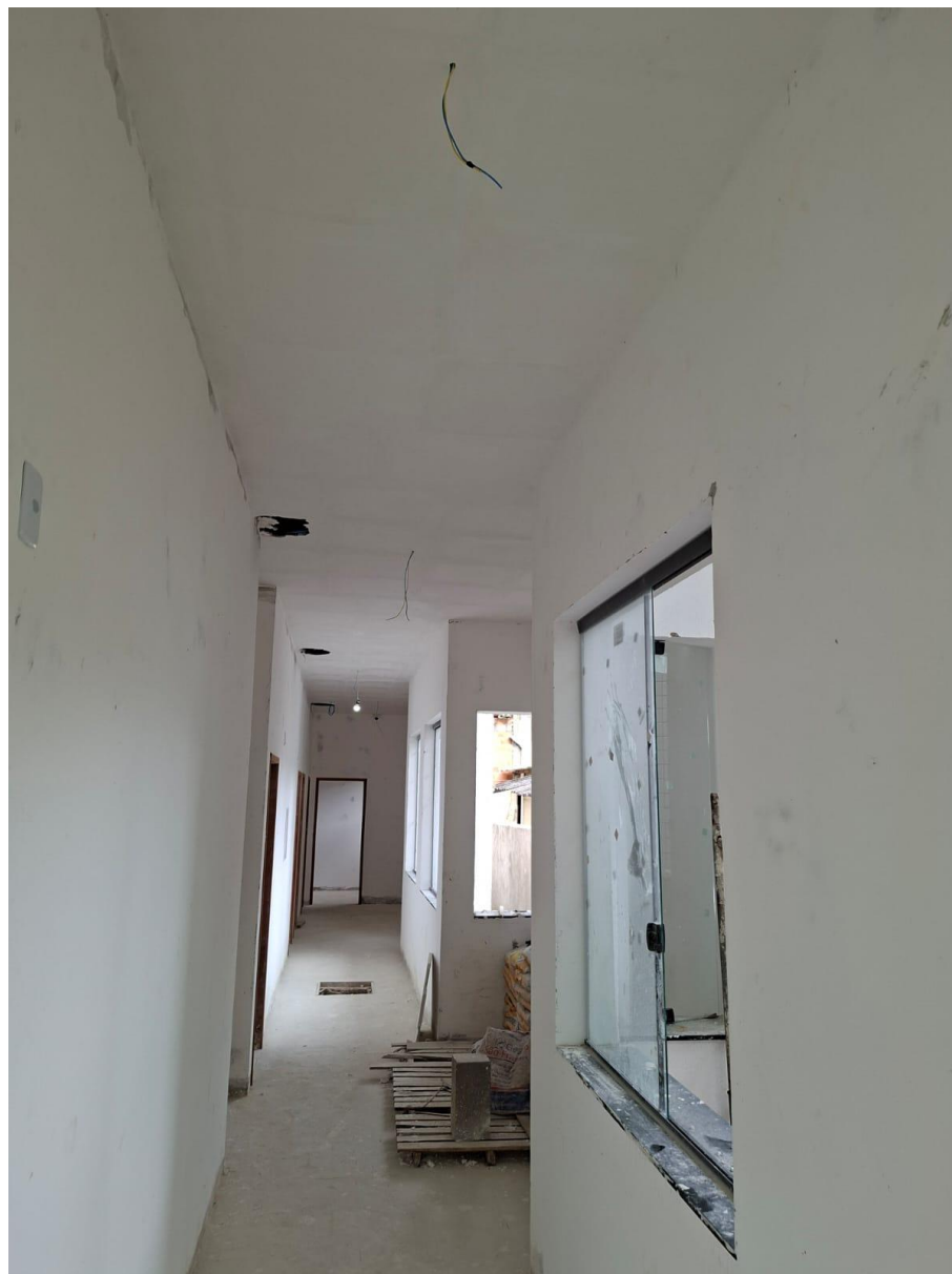
Imagem 06: Gesso, parte elétrica e rede lógica instalada no corredor

Contrato: 015/2024 – Período Medido: 01/12/2025 a 31/03/2026