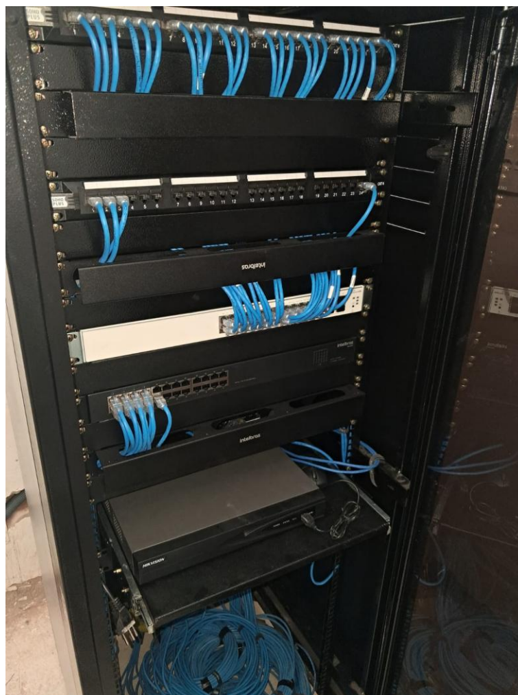
Imagem 12: hack de lógica instalado

Contrato: 015/2024 – Período Medido: 01/12/2025 a 31/03/2026