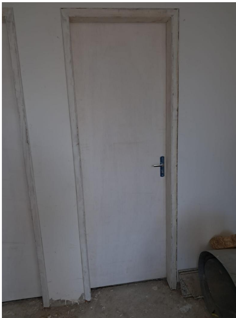
Imagem 10: emassamento de porta de madeira

Contrato: 015/2024 – Período Medido: 01/12/2025 a 31/03/2026