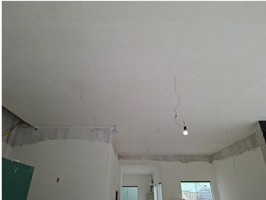
Imagem 01: forro de gesso instalado

Contrato: 015/2024 – Período Medido: 01/12/2025 a 31/03/2026