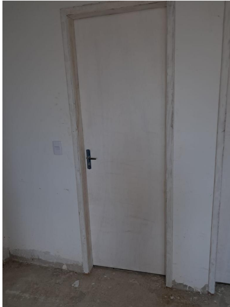
Imagem 11: emassamento de porta de madeira

Contrato: 015/2024 – Período Medido: 01/12/2025 a 31/03/2026