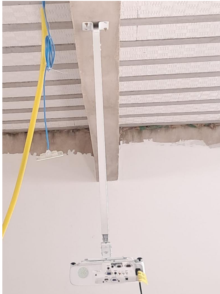
Imagem 09: Projetor Epson fixado

Contrato: 015/2024 – Período Medido: 01/12/2025 a 31/03/2026