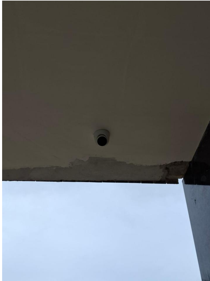
Imagem 04: Camera externa instalada

Contrato: 015/2024 – Período Medido: 01/12/2025 a 31/03/2026