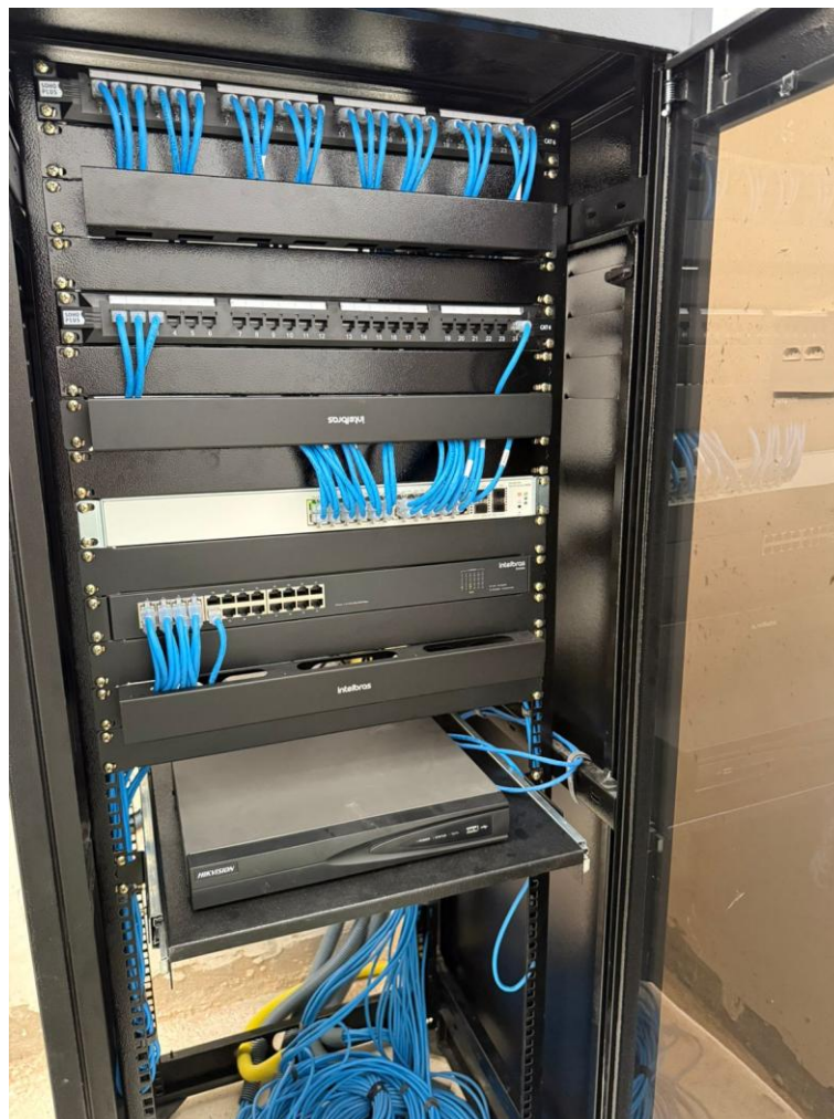
Imagem 13: rack de lógica instalado

Contrato: 015/2024 – Período Medido: 01/12/2025 a 31/03/2026