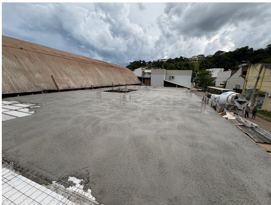
Imagem 05: Concretagem da laje 1º pavimento

Contrato: 014/2025 – Período Medido: 01/03/2026 a 31/03/2026