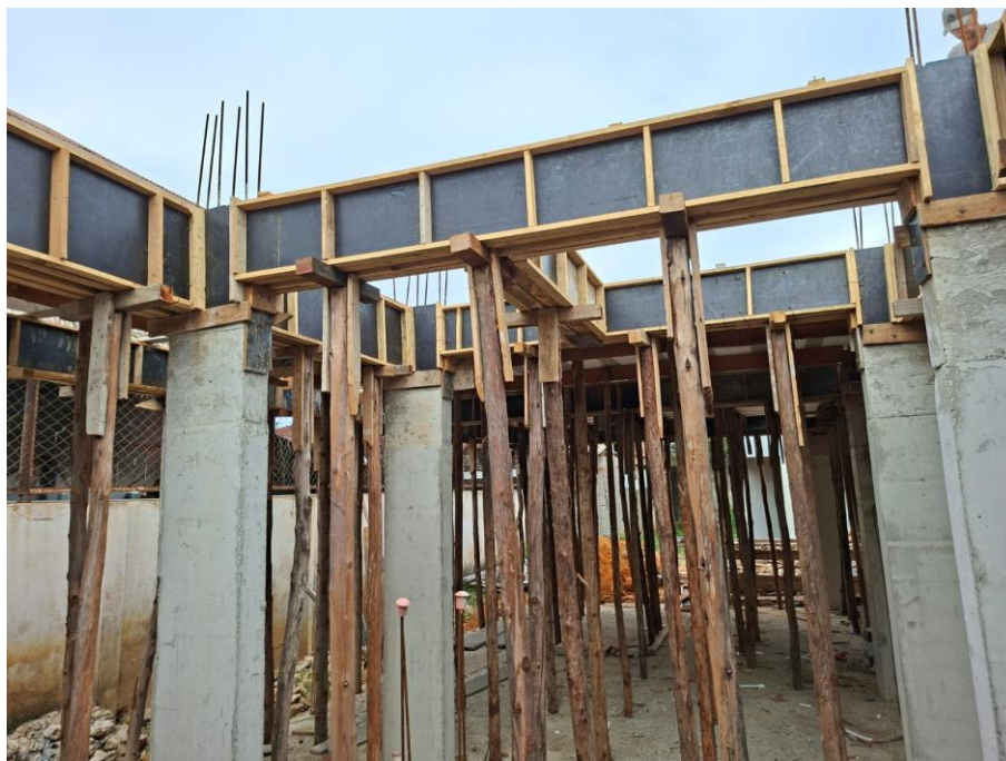
Imagem 03: forma e armação do 1º pavimento

Contrato: 014/2025 – Período Medido: 01/03/2026 a 31/03/2026