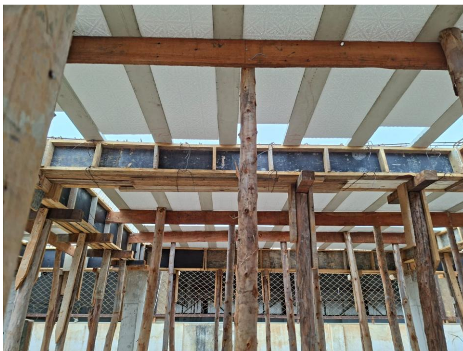
Imagem 01: forma e armação do 1º pavimento

Contrato: 014/2025 – Período Medido: 01/03/2026 a 31/03/2026