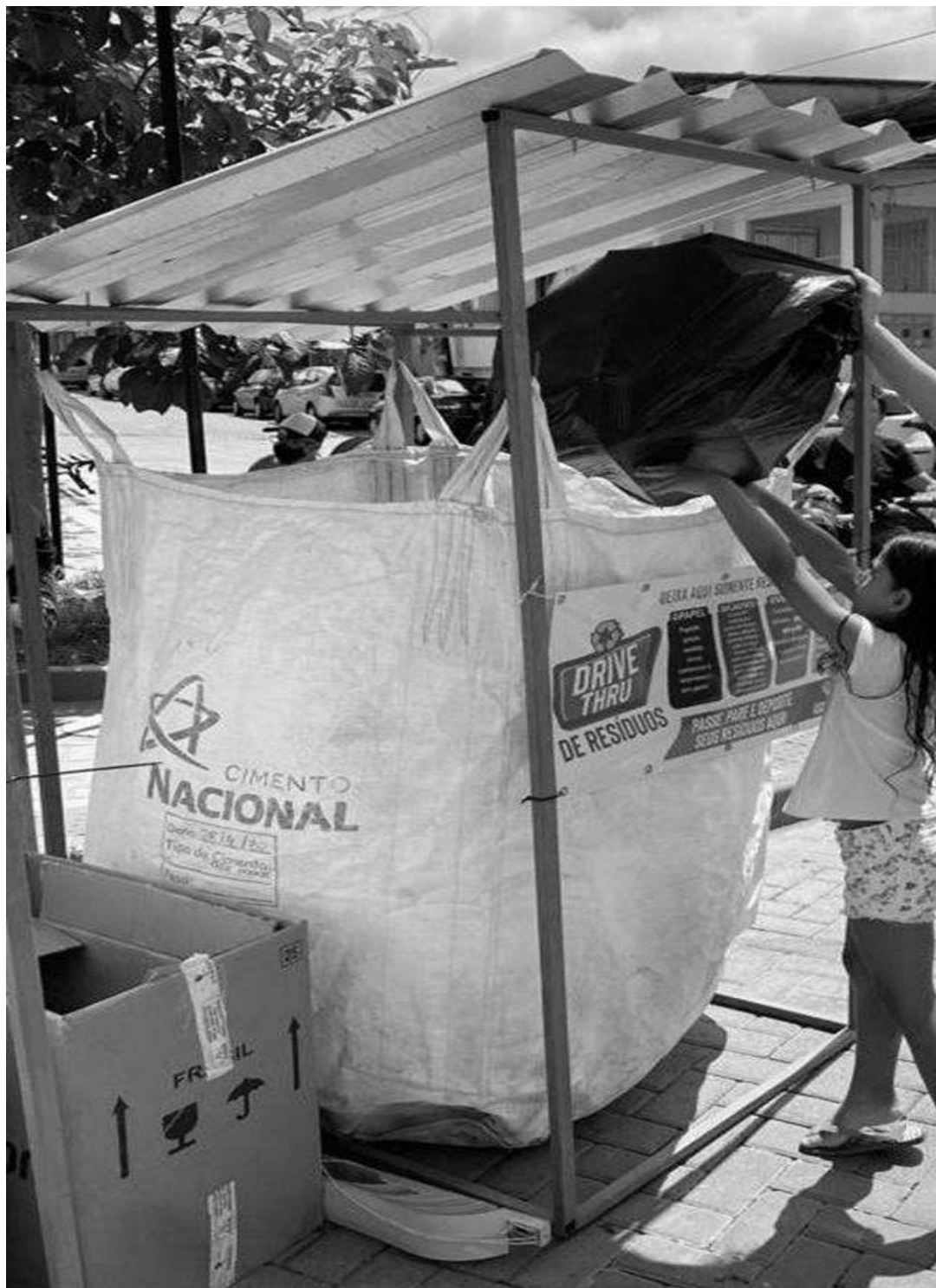
Imagem 1 – PEV, Banner e Big Bag (Itens 1,2 e 3)

AV. PRESIDENTE VARGAS, Nº 157, CENTRO – TEL: (27) 3258-4700 – FAX (27) 3258-4724 CEP: 29680-000 – JOÃO NEIVA/ES – CNPJ: 31.776.479/0001-86